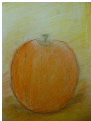
【みかん】 桜井 慎治 様 (宮前フレンズ)