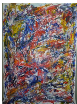
【秋】 F・M 様 (宮前フレンズ)