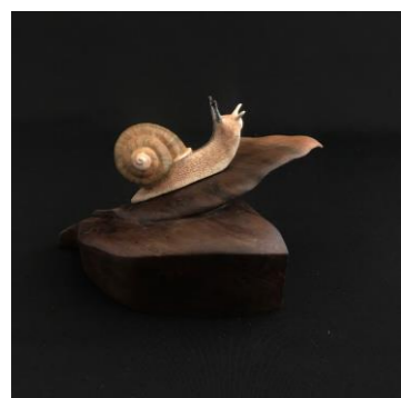
【ナミマイマイ】 岳 様 (オリオン)

今回は、社会福祉法人アピエの地域生活支援センターオリオンと地域活動支援センター宮前フレンズに通う利用者様からの作品を提供していただきました。